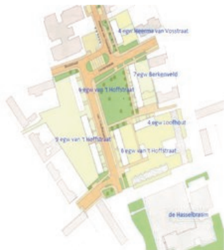
Plattegrond Van 't Hoffstraat e.o.

Het is een spannende periode voor de bewoners van de 36 woningen in de Van 't Hoffstraat e.o. Er wordt besloten over de toekomst van de woningen en zij spelen daar een belangrijke rol bij.