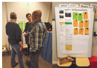
Raadplegingsbijeenkomst 27 november

27 november was het zover. De bewoners kregen een presentatie van de mogelijkheden en gelegenheid om vragen te stellen en van gedachten te wisselen.