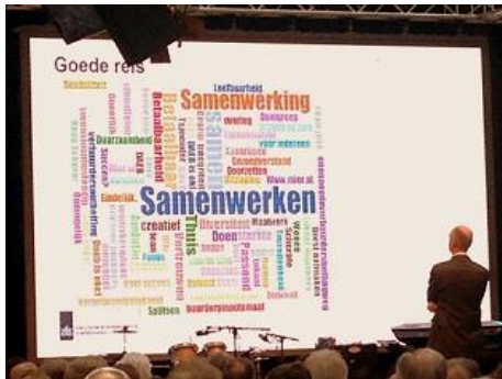
Minister Blok wenst gemeenten, corporaties en huurdersorganisaties een goede samenwerking toe.

In het verleden maakten de gemeente Etten-Leur en WEL samen prestatieafspraken. De HBV kon wel aangeven wat zij er van vond, maar was geen partij. Sinds 1 juli is dat anders. Door een wetswijziging is de HBV voortaan een volwaardige partij bij de prestatieafspraken. Dat betekent meer invloed voor de HBV.