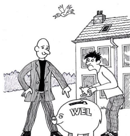
WEL incasseert de huur (illustratie Kees Roozkrans)

De HBV moet nu overwegen of verdere acties gewenst zijn, om WEL op het goede spoor te zetten. Daarbij is de stem van u, als lid van de HBV, natuurlijk belangrijk. Op de jaarvergadering op 12 mei (z.o.z.) is dit een van de belangrijke onderwerpen. Alleen met uw steun kunnen wij dit karwei klaren.